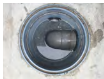
きれいな状態の桝

家庭から出たトイレ以外の排水は、汚水桝（トラップ桝）でゴミや油を取り除いてから下水道管に流れます。そのため、汚水桝を放置すると、排水管の詰まりや悪臭の原因になります。ゴミや油などは定期的にすくい取り、新聞紙などに包んで燃えるゴミとして処分してください。