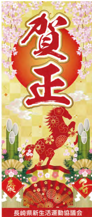
長崎県新生活運動協議会