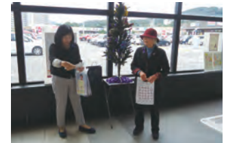
イオンタウン長与

内閣府では、11月12日～25日を「女性に対する暴力をなくす運動」期間と定めており、本町では、その啓発活動の一環として、中学生が女性に対する暴力を根絶しようというメッセージが込められたパープルリボンを作成してツリーに飾り付け、暴力のない学校および長与町を発信する取り組みを行いました。