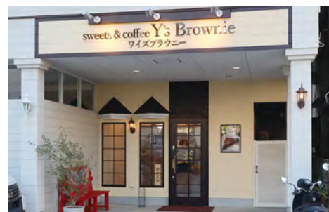
▲外観（手作りの赤いベンチが目印）