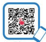
長与町 ホームページ