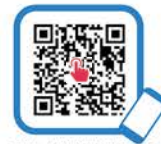
長崎広域連携中枢 都市圏ビジョン ホームページ