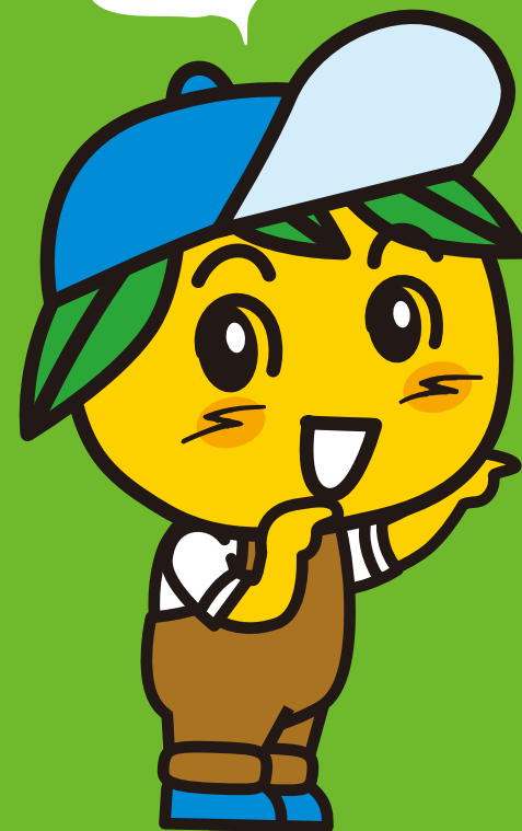
長与町イメージキャラクター「ナガヨミックン」