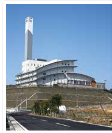
クリーンパーク長与