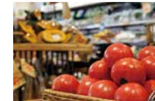
←店内には新鮮な食材が並ぶ