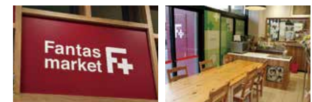
↑ファンタスマーケットのロゴ

「ゆっくりした気分で買い物と料理をして、大事な人に食べてもらうのが一番の幸せです。食卓の幸せが家族の幸せを作る。食卓から家族の幸せを支えたいです」とにこやかに話してくれました。