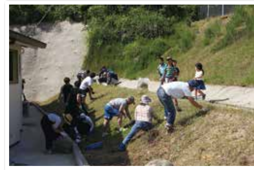
毎年6月の第1日曜日に町民一斉清掃を実施しています。