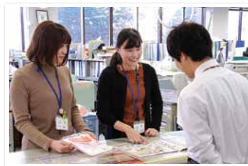
住民の皆さまにわかりやすい説明を心がけています。