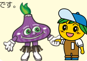
ミスターレッド ナガヨ ミックン

左の表から、面積・河川・学校など似ている点が多く見られます。また、みかんや赤玉ねぎを主にした農業で栄えた町というところも似ています。現在は県庁所在地（長崎市）や州都（ハートフォード）のベッドタウンとして閑静な住宅街が形成されているとともに、自然に囲まれたとても住みやすい町です。