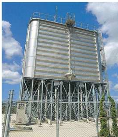
[まなび野高部配水池]