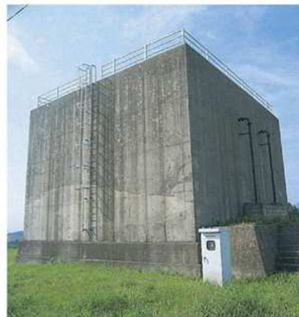
[南陽台高部配水池]