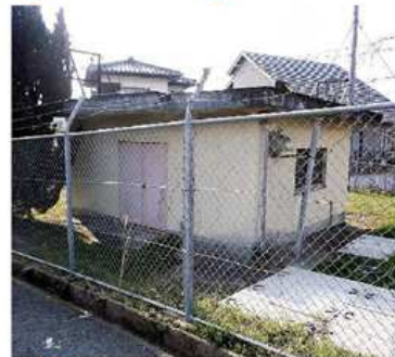
【ニュータウン接合井】