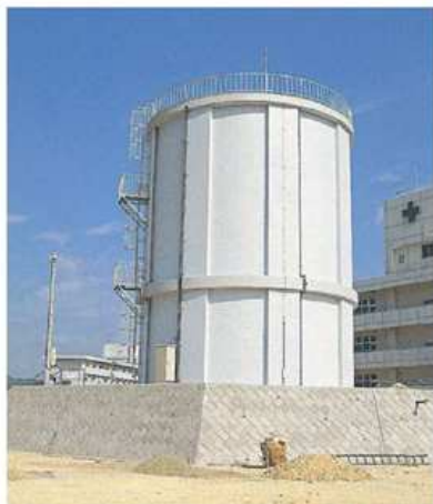
[サニータウン高部配水池]