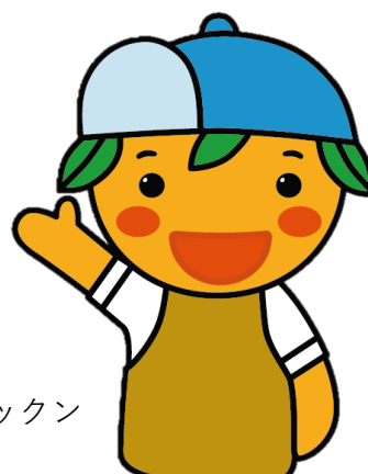
長与町マスコットキャラクター ミックン